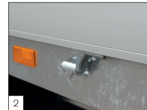
2 Standaard: rondom scharnierpunten aangebrachte haak voor eenvoudige montage van o.a. ladingnet.