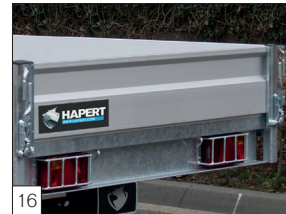
16 Optie: achterlicht afscherming, voorzien van scharnierend achterbord boven en onder (alleen mogelijk i.c.m. borden 400 mm hoog).