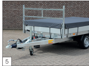
5 Optie: ladingnet, fijnmazig.