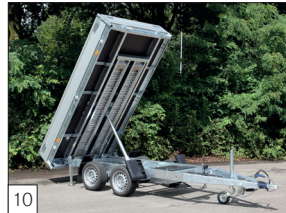
10 Optie: 'Oprij'-pakket: 2 geïntegreerde aluminium oprijbalken, 2500 mm lang met 2 sterke, verstelbare uitzetsteunen met slinger.