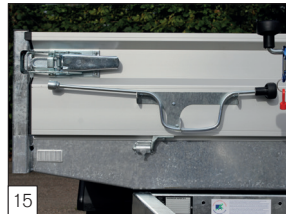
15 Optie: slinger voor uitzetsteunen gemonteerd aan de voorzijde.