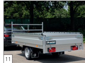
11 Optie: Combi Protect Rail gemonteerd op de aluminium zijborden.