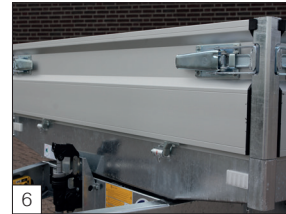
6 Standaard: met 4 degelijke hoekronden en een scharnierend voorbord.