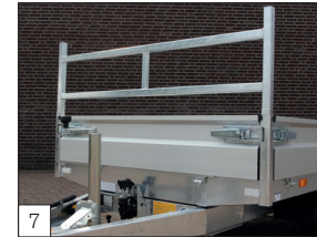
7 Optie: afneembaar voorrek gemonteerd.