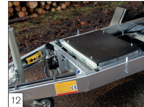
12 Optie: elektrische bediening met accu i.p.v. handpomp.