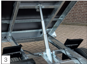
3 Standaard: voorzien van degelijke drietrapscilinder.