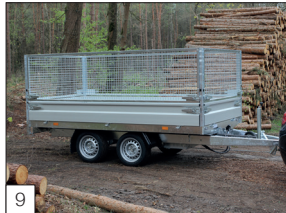
9 Optie: afneembaar gaasrekwerk 700 mm hoog.