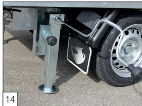
14 Optie: zware uitzetsteunen gemonteerd.