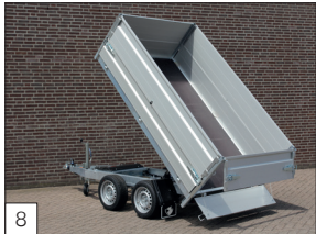
8 Optie: aluminium opzetborden 400 mm hoog, pendelbaar.