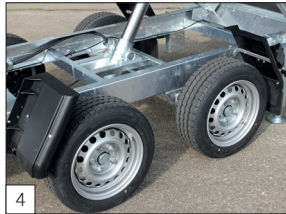
4 Standaard: een verlaagd onderstel met banden 195/50 R13.