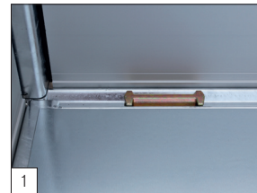
1 Standaard: voorzien van TÜV-goedgekeurde bindbeugels.