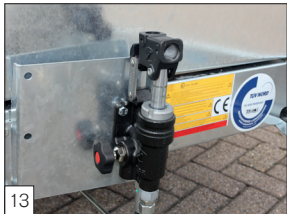
13 Optie: noodhandpomp bij elektrische pomp gemonteerd.